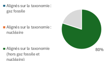
1. Alignement des investissements sur la taxinomie, dont obligations souveraines*